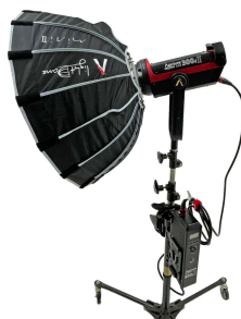
Aapture 300d II